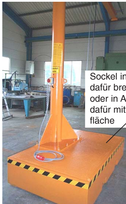
Sockel in Ausführung flach, dafür breiter und länger oder in Ausführung hoch, dafür mit geringerer Stell- fläche