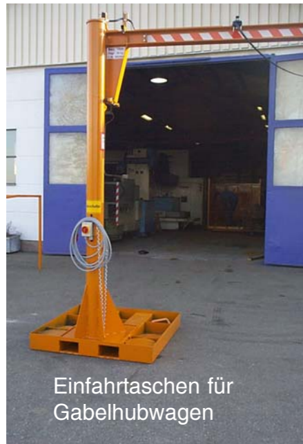
Einfahrtaschen für Gabelhubwagen