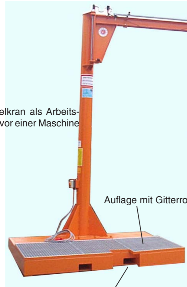
Auflage mit Gitterrost